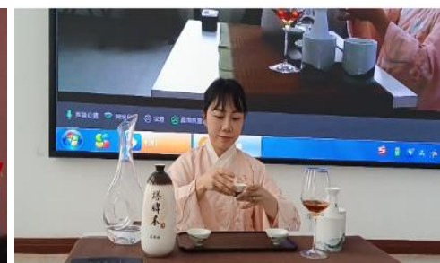
品读绍兴黄酒文化