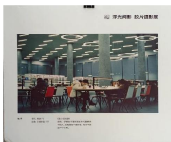
“浮光阅影”摄影作品