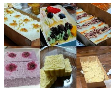
篷茗花斋自制甜品