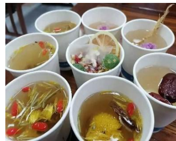
篷茗花斋自制花茶