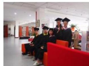
流光瞬影——我们的故事还在继续……