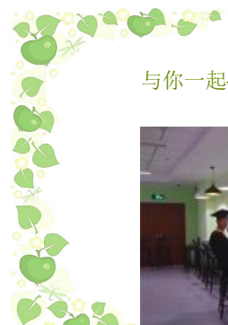
与你一起——心若止水……