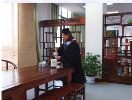
简讯：“巍巍图书馆、景如画”等摄影作品获浙江省图书馆学会“最美阅读空间”摄影大赛优秀奖